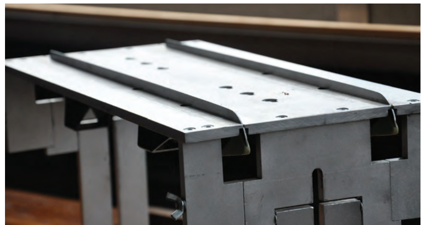
Figuur 7 Schaatsen in slijpblok.

Om docenten verder te informeren over deze experimenten is er een werkgroep op de Woudschotenconferentie 2013. Zodra de experimenten beschikbaar zijn zal dit bekend gemaakt worden op www.tue.nl/schaatsproject .