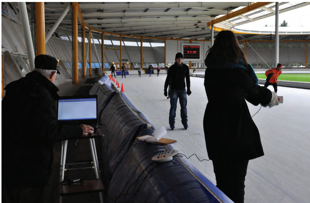
Figuur 5 Creëren van een x,t -diagram (experiment 4).

sensor zijn in het laboratorium met een luchtkussenbaan en een vlakke metalen plaat mooie x,t -diagrammen te maken. Ook na tweemaal differentiëren zien de grafieken er vaak nog zeer netjes uit, ook zonder bewerking van de metingen.