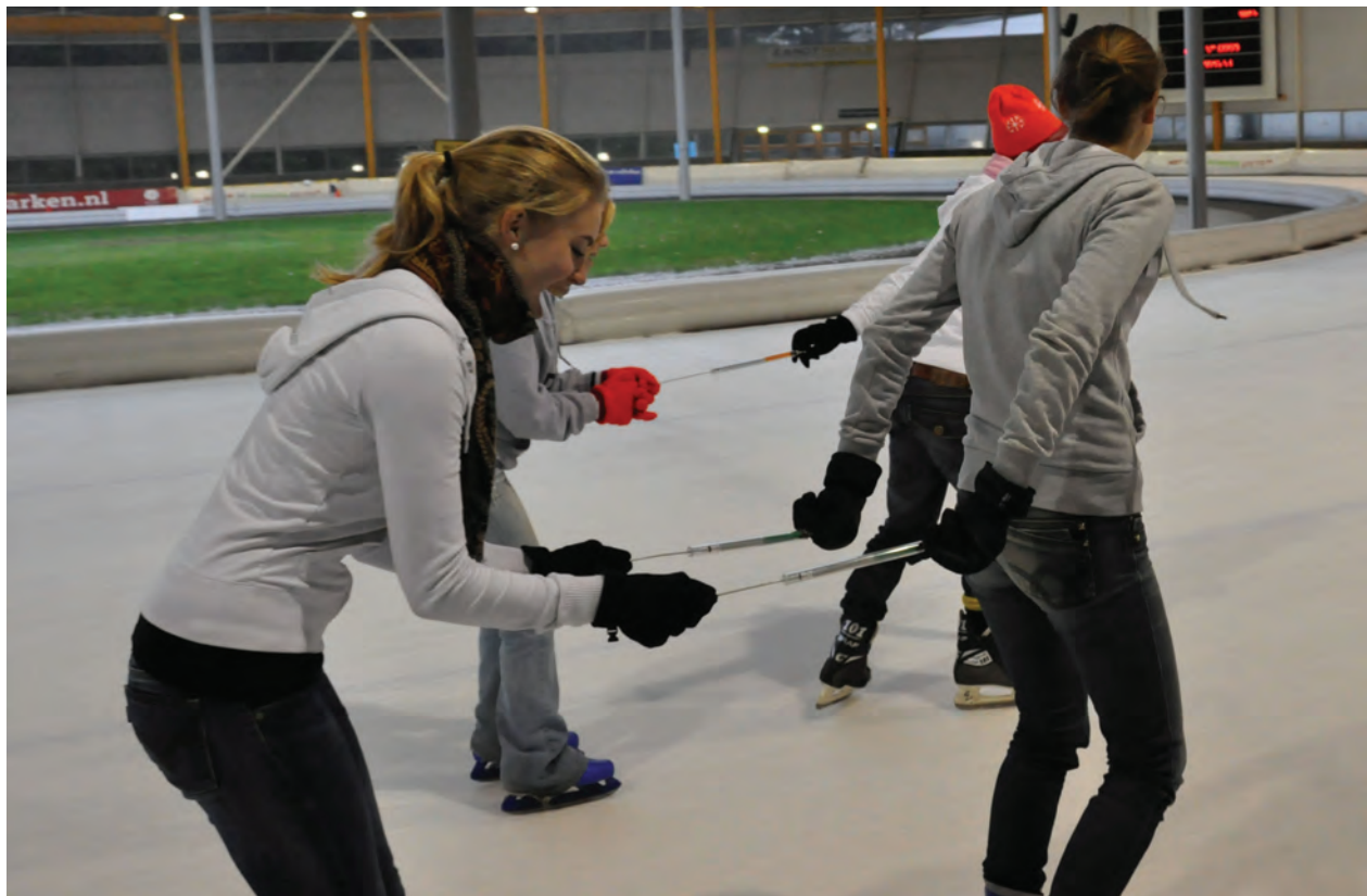
Figuur 2 Bepaling glijwrijving (experiment 2).