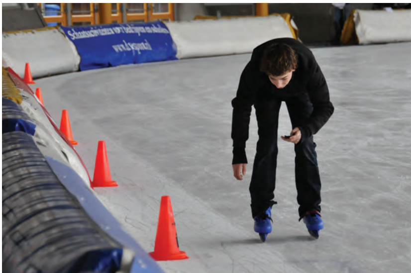
Figuur 4 Meting van de tijdsintervallen met geheugenstopwatch (experiment 3).

vaardigheid en schaatstype op deze metingen een verwaarloosbaar effect hebben. Omdat het nationale jeugdteam ijshockey in Eindhoven traint en een aantal van deze kinderen op het Sint-Joriscollege zitten kan het verschil tussen de schaatsvaardigheid en schaatsen van leerlingen in een groepje groot zijn. Zelfs bij deze technisch betere schaatsers blijkt de glijwrijvingscoëfficiënt niet af te wijken. Als meerdere groepen met elkaar vergeleken worden, blijkt wel de ijskwaliteit (voor of na een baanverzorging) invloed te hebben op de meetresultaten. Binnen één groep valt dat niet op omdat ze als groep binnen korte tijd allemaal deze metingen hebben uitgevoerd.