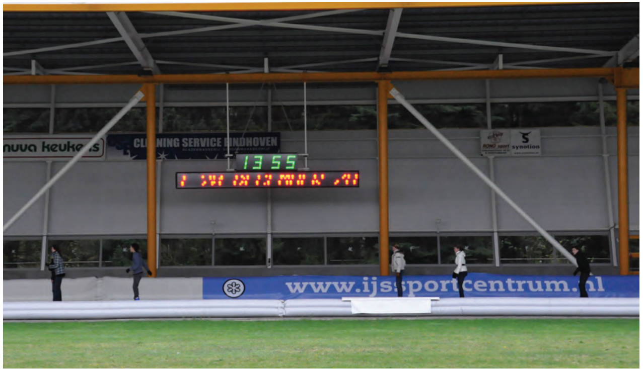
Figuur 6 Opname voor videometing (experiment 5).

het eerste experiment (Arbeid en kinetische energie) wordt dan een iets moeilijker in verband met de uitglijafstand.